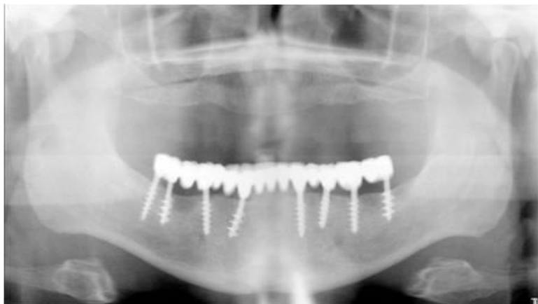
Foto B: La procedura seguita fu quella del carico precoce: il ponte fisso definitivo su impianti della figura fu applicato 10 gg dopo l'intervento. Nella scelta del materiale, il metalpolicarbonato, si seguì la tendenza del momento.

La foto A mostra 8 impianti a moncone emergente, i più funzionali al carico immediato, applicati 7 anni fa nella mandibola edentula di un paziente 60enne.